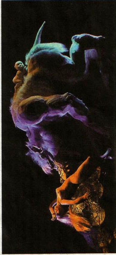
Una escena de la obra Aullidos , de Teatro Corsario.